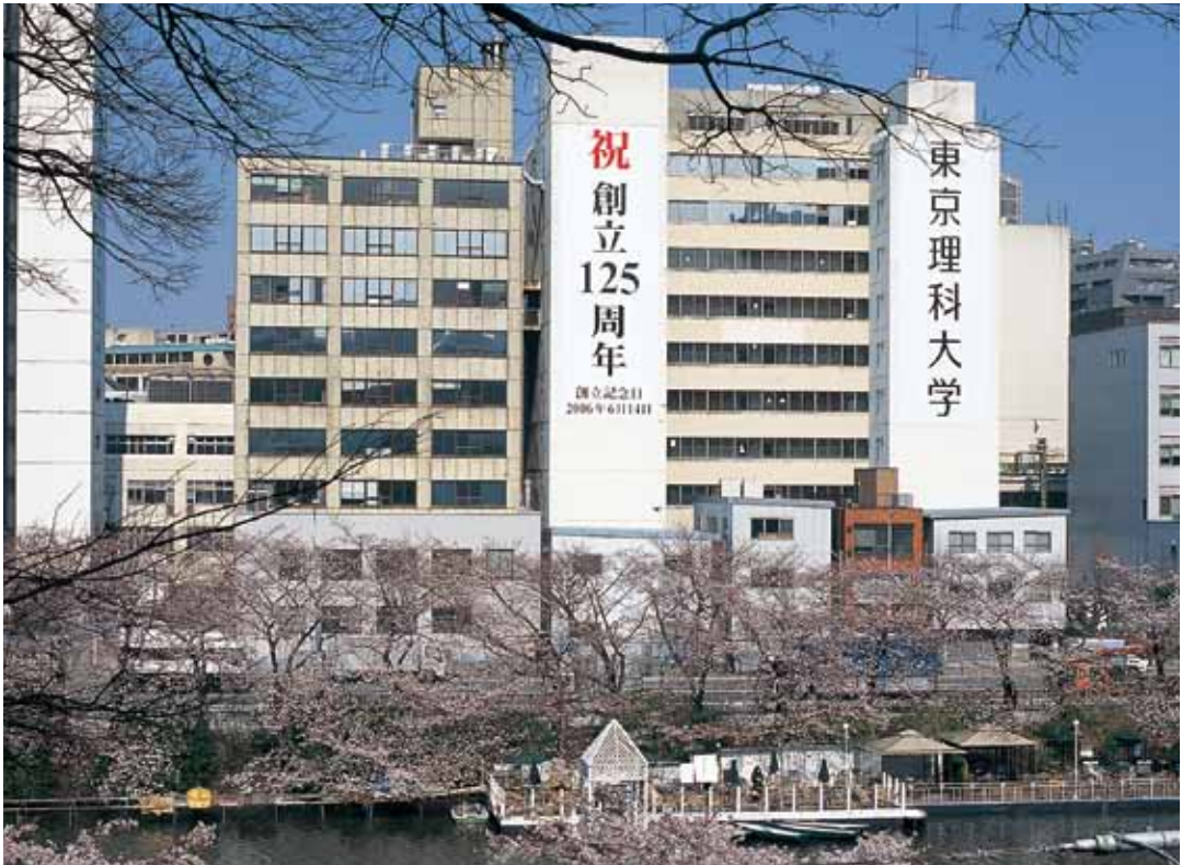
7号館と9号館 創立125周年の頃