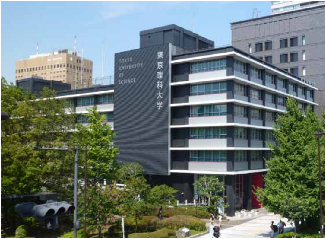
立地条件に恵まれた九段校舎