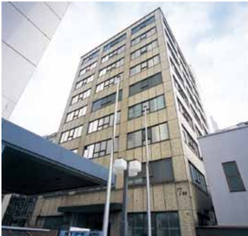
モザイクタイルが特徴の7号館