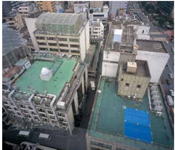
0 工学部の建物 2・3・7・8・9号館