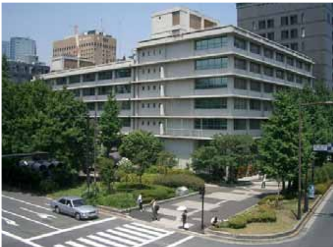
改装前の旧・日本住宅公団本社ビル