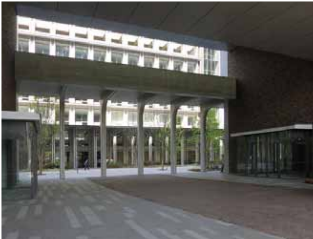
研究棟から講義棟を見る