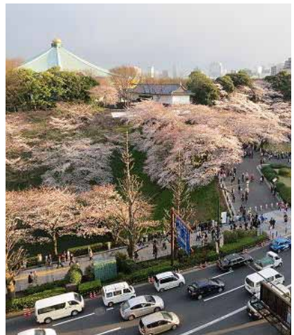
M 満開の桜と武道館