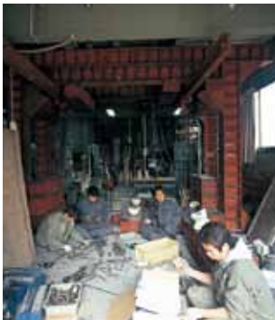
構造実験室 狭くても工夫