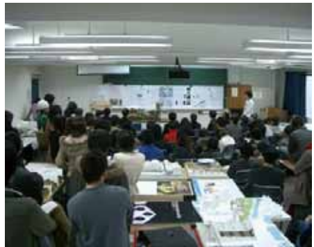
0 設計製図講習会 9号館第5製図室で