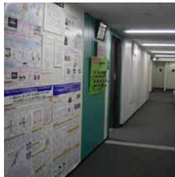
M 廊下壁面は掲示スペースに活用