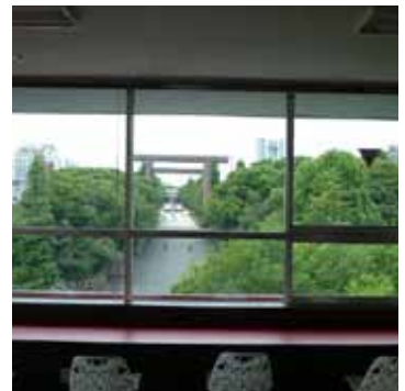
M 新緑の靖国神社を学生談話室から眺める