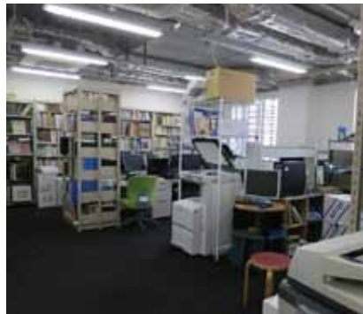
M 広くなった研究室